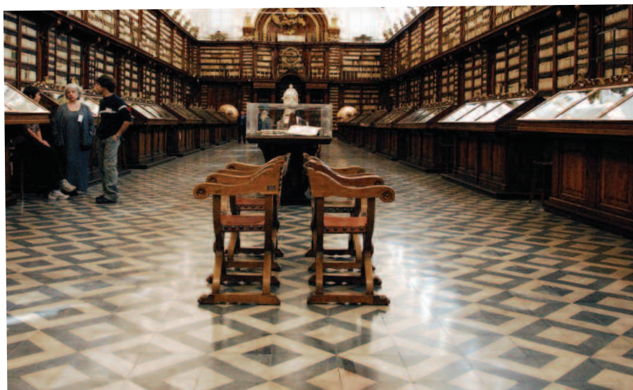
Insula sapientiae, 2013

SENATORAGAZZILAB.IT: HOME-DDL DEI RAGAZZI-ARCHIVIO 2013-2014